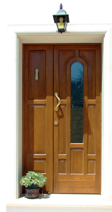
Portone a due ante asimmetriche bugnato