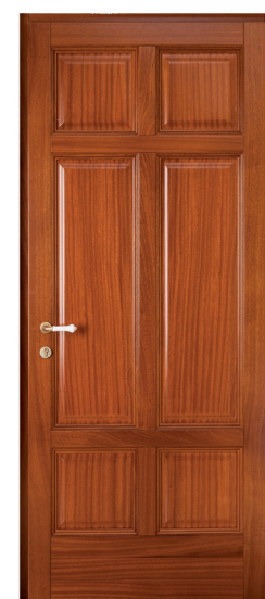
Portone ad un'anta bugnato

Il portone d'ingresso è il biglietto da visita della casa e ogni portone realizzato racconta qualcosa di chi lo ha commissionato. Per questo prestiamo particolare attenzione nella realizzazione dei nostri portoni: Bugnato, dogato, inciso, storico, con lavorazioni speciali su cornici, moderno, con design esclusivo. Tante opzioni ma stessa robustezza e sicurezza per l'infisso che più di tutti segna il confine tra il dentro ed il fuori di una casa.