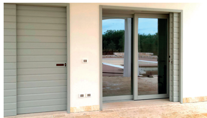
Alzante scorrevole vista esterna con portellone tipo mercantile scorrevole interno muro

L'aggiunta di una maniglia passante con serratura permette l'apertura dall'esterno. Lo stesso sistema è realizzabile in più ante scorrevoli o fisse.