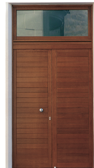
Portone a due ante con doga incollata a sagoma lisca con sopraluce fisso