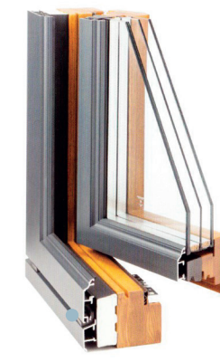
profilo legno/alluminio Termoscudo della serie UNIFORM ad elevato isolamento termico con polistirene

L'infisso legno-alluminio e legno-bronzo risponde bene alle esigenze di alta protezione esterna del legno. Si tratta di un infisso in legno ma con un profilo esterno in alluminio o bronzo personalizzabile nelle forme e nei colori: Decorati legno, decorati metallo, bronzo, colori opachi o strutturati. Una vasta gamma di scelta per un infisso esente da manutenzione esterna.