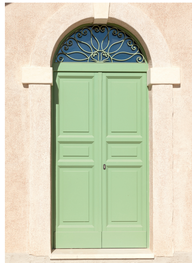
Portoni bugnati con sopraluce ad arco