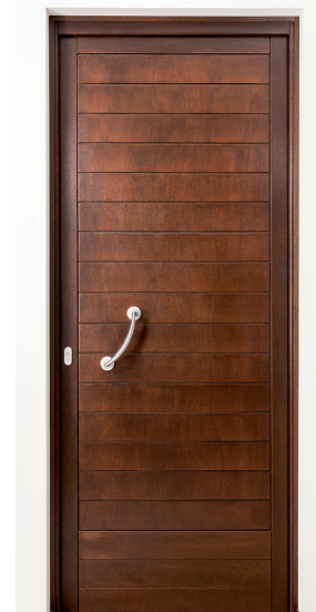
Portone ad un'anta con doga orizzontale incisa