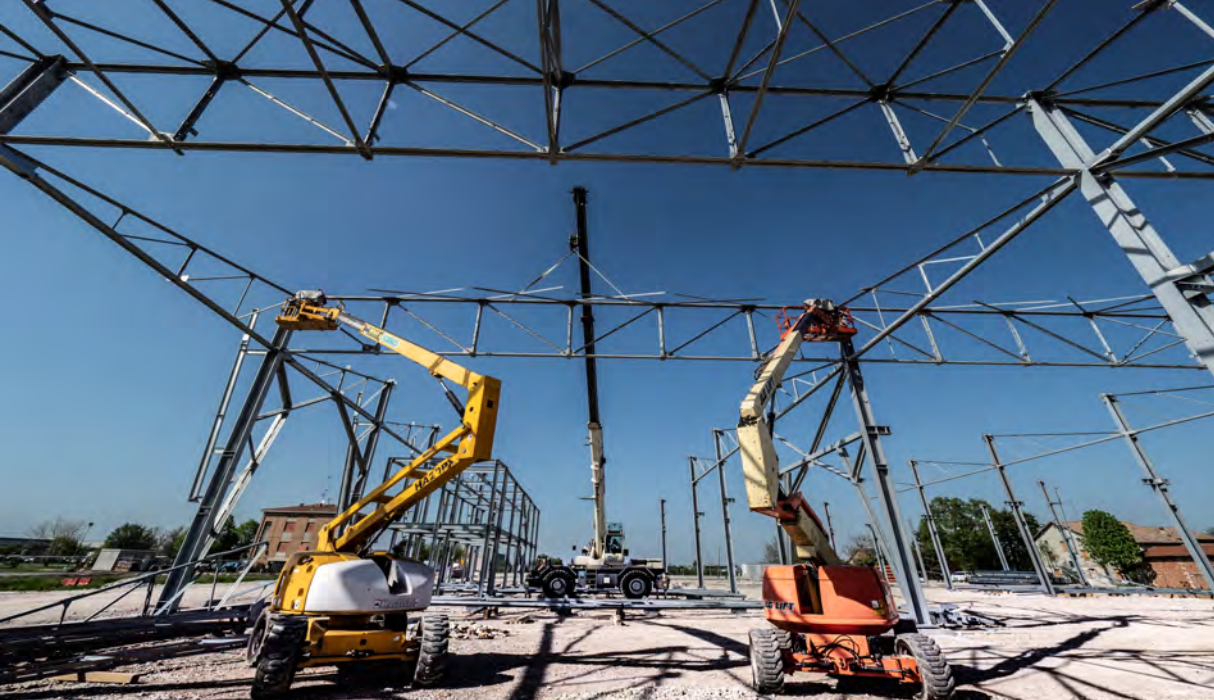
Installazione delle travi reticolari in carpenteria metallica