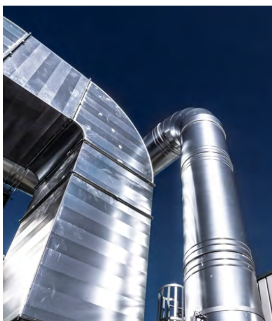
Impianti di aspirazione presenti nell'apposito soppalco scoperto