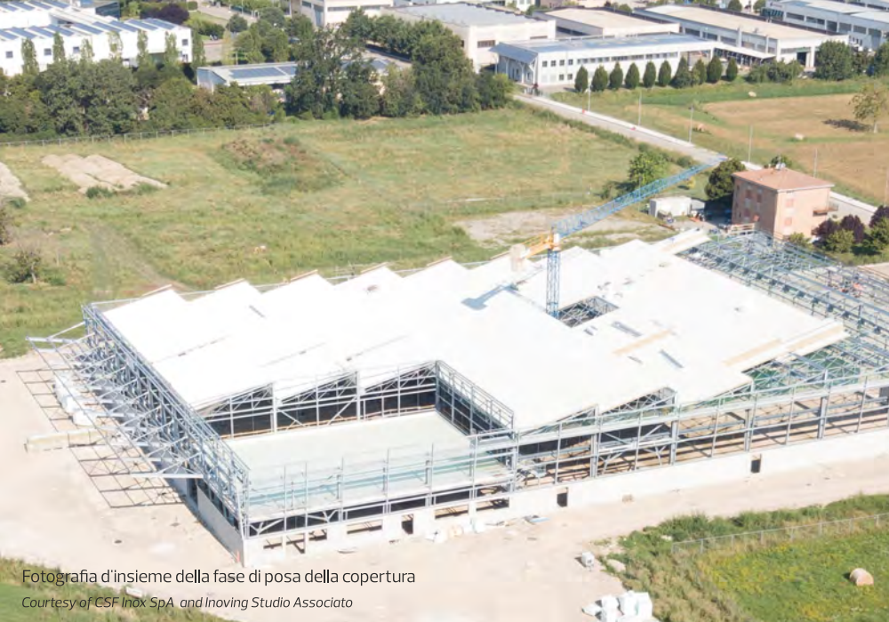
Fotografia d'insieme della fase di posa della copertura