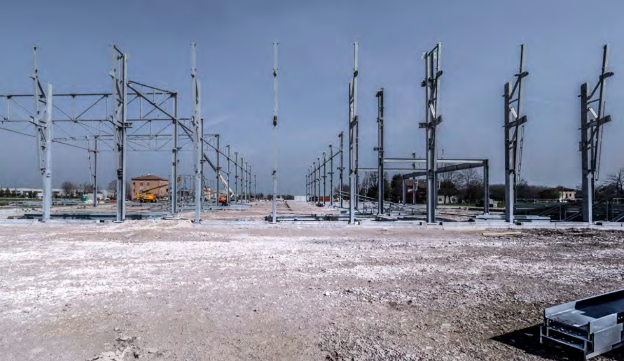
Installazione delle strutture in carpenteria metallica