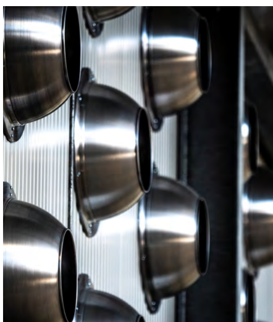
Particolari dell'impianto di trattamento aria